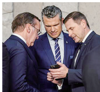
2025年10月15日，在比利时布鲁塞尔举行的北约防长会议结束后，美国国防部长赫格塞思（中）与欧洲国家官员交谈。