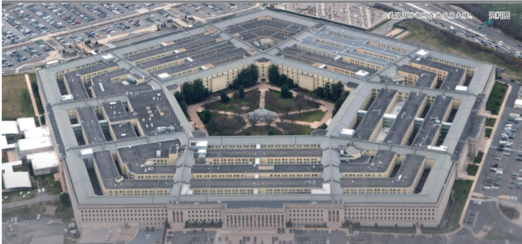
美国国防部所在地五角大楼。 资料图