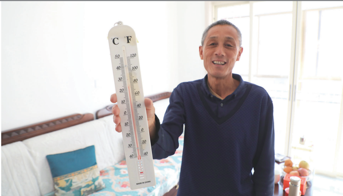
居民展示家里的温度。