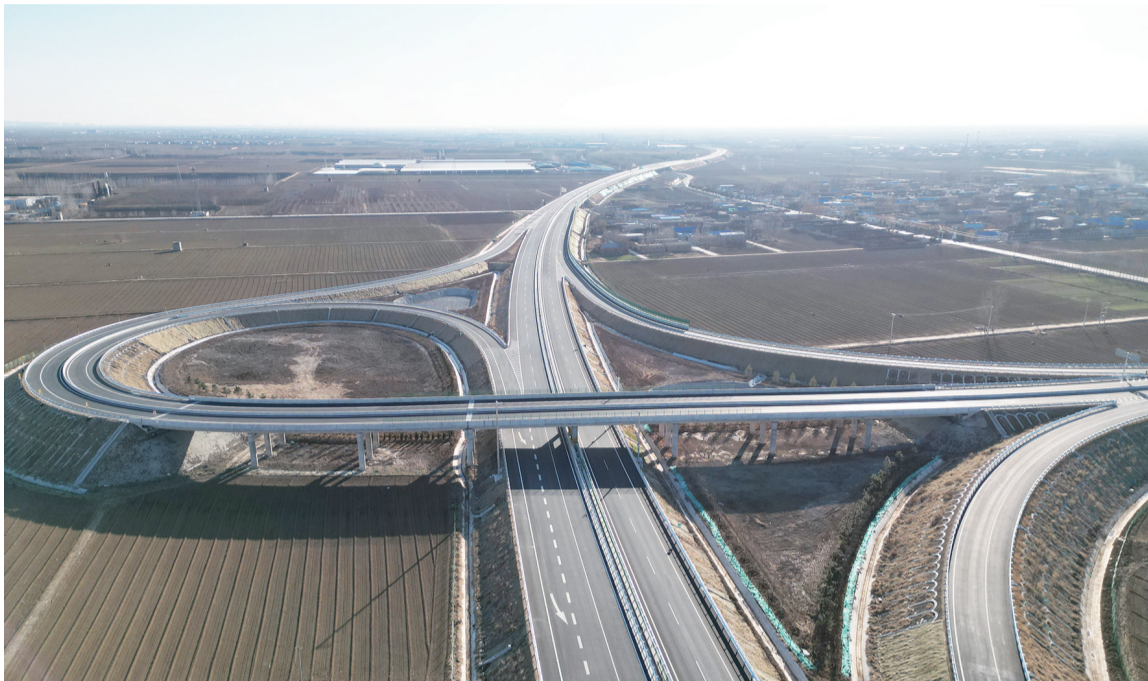
济微高速宁阳段。

本报讯（记者 温雯）12月26日0时，历时两年多的济南至微山高速（以下简称“济微高速”）济南至济宁新机场段项目通车，济微高速全线贯通。