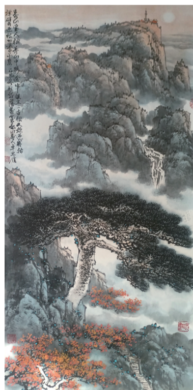
《泰山望人松》136厘米×68厘米。