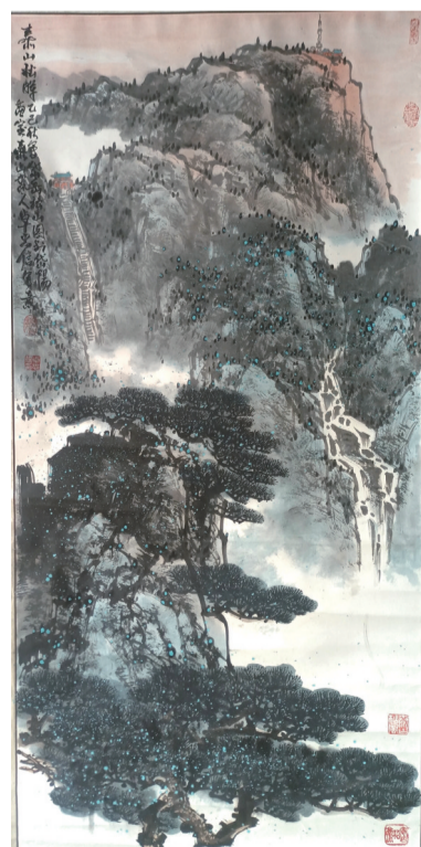
《岱宗松晖》136厘米×68厘米。