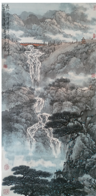
《泰山龙潭瀑布》138厘米×68厘米。