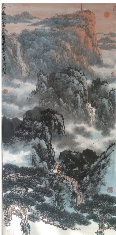
《泰山松云》138厘米×68厘米。