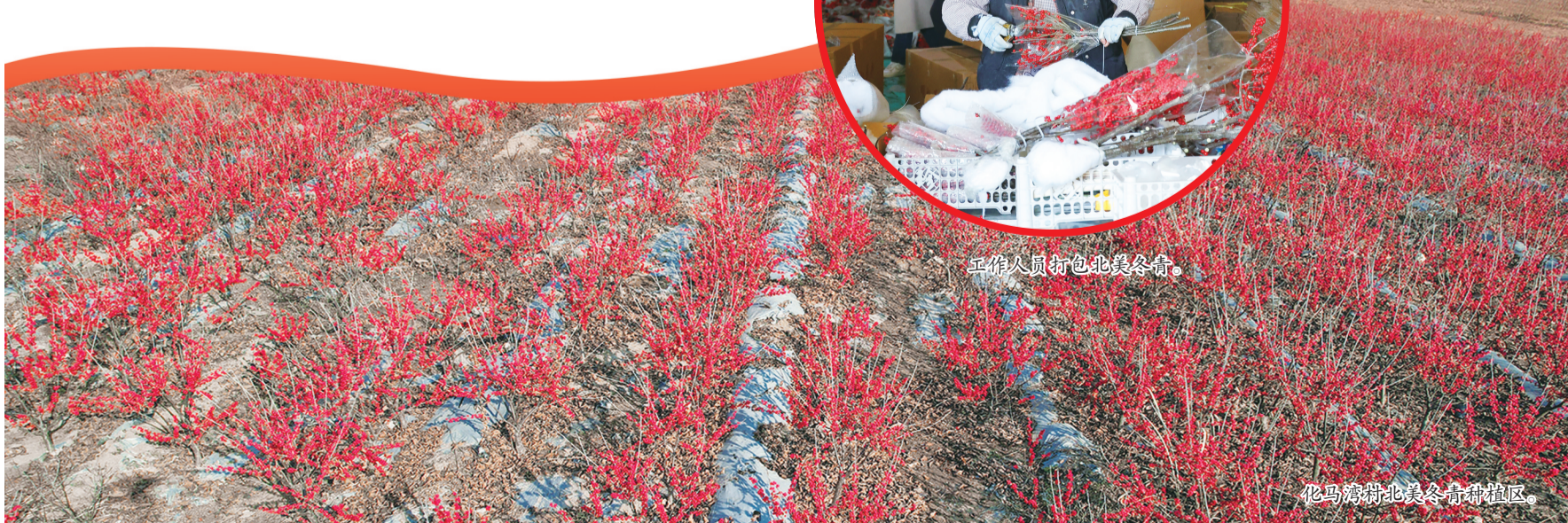
化马湾村北美冬青种植区。

今日，晴间多云，早晨有轻雾，南风3到4级阵风5到6级，湖面4到5级阵风6到7级。最低气温-2℃左右，最高气温10℃左右。