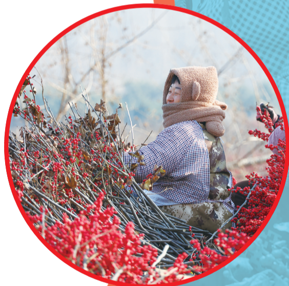
工作人员在地头分拣北美冬青。