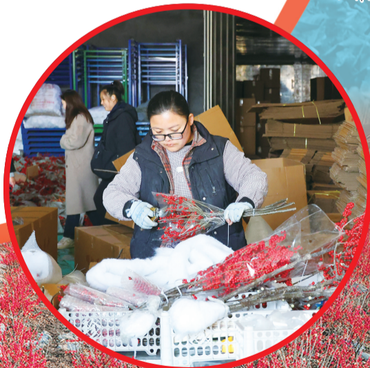
工作人员打包北美冬青。