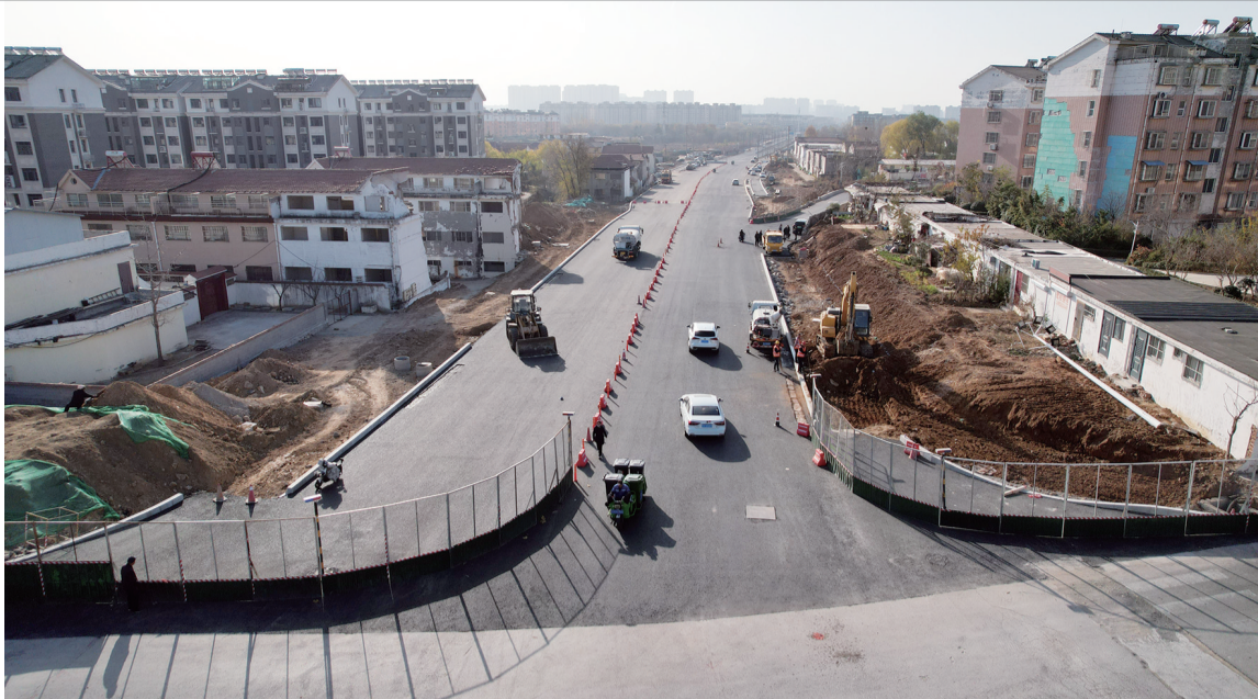
双龙路(紫欣园街—谢过城大街)施工现场。