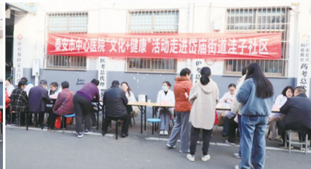
居民参加义诊。 通讯员供图

携带先进检查设备,为居民提供免费视力检测、白内障初筛、干眼症诊断等服务,针对老年人常见的老花眼、青光眼风险,逐一给出“科学用眼、定期检查”的建议;口腔科专家围绕牙齿脱落修复、牙周病预防、老年人假牙护理等问题,为居民开展口腔检查,教大家正确的刷牙、护牙方法。