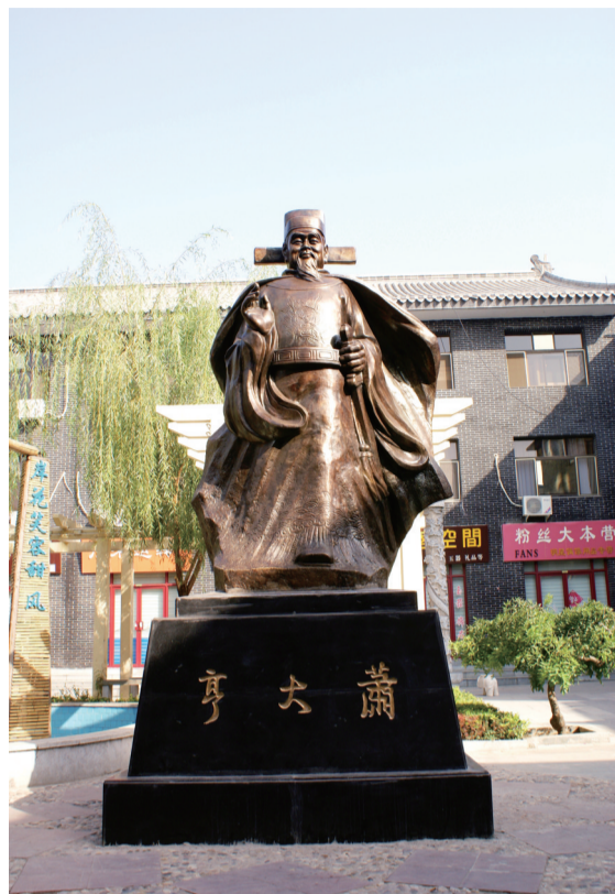
萧大亨铜像。

萧大亨为明代后期的泰安籍名臣，嘉靖进士，万历时历官刑部、兵部尚书，对当时的朝政有重要影响。萧公故居在泰安老县衙旧址，清张延龄《重修泰安邑廨记》云：“邑廨旧为前明萧太保宅。”除主体建筑外，宅南有园林（世称萧家湾），东有萧公祠（故址在今英武街）。建筑規制宏阔，营造富丽。入清后，因萧大亨后裔萧启潜以“谋叛”被斩，家族遭到查抄，甲第没入官府，此后逐渐废弃。