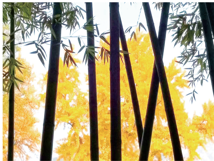
婆婆的树影间透出一抹金黄。