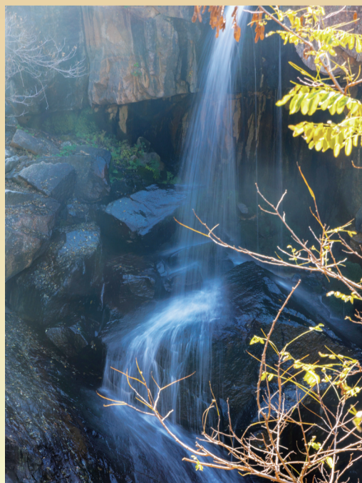
水流在山谷间倾泻而下。