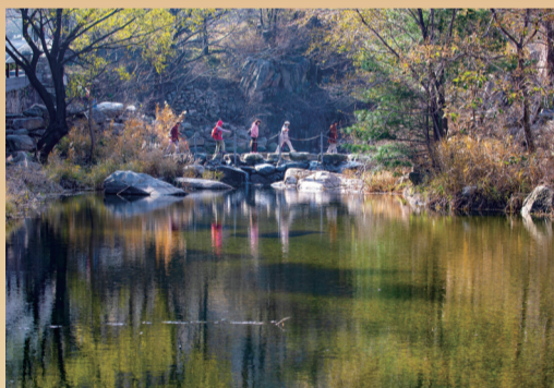
游人在溪水边漫步。

◎总第452期 ◎2025年11月20日 星期四 ◎责编/崔倩 ◎美编/郑唯唯 ◎审读/常质斌 ◎本期统筹/翟峰 李岩 ◎出品/泰山景区 泰安传媒集团