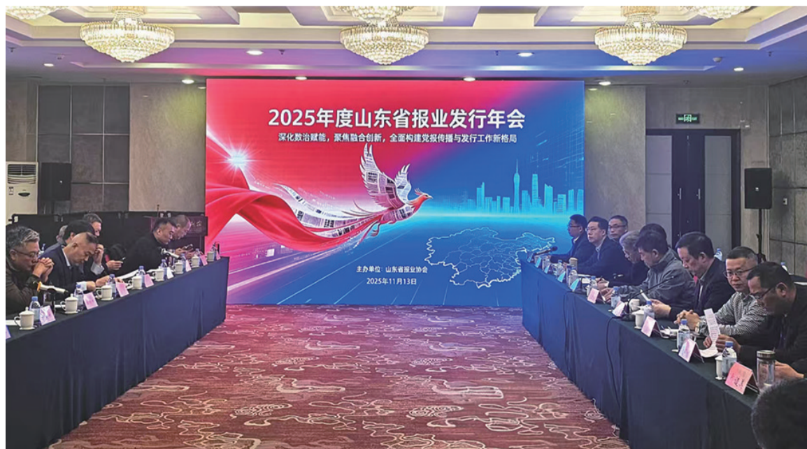
2025年度山东省报业发行年会会议现场。