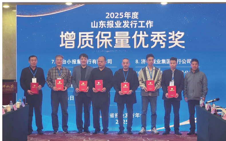
获奖代表上台领奖。