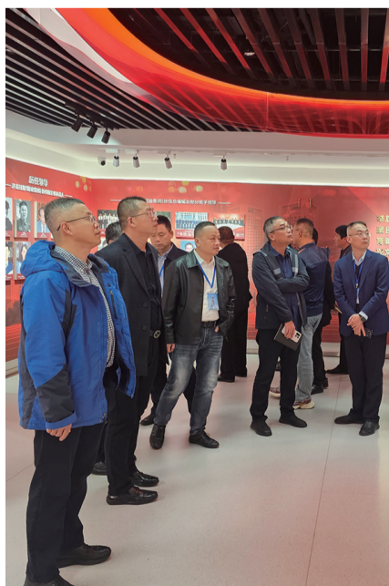
与会人员参观济南日报报业集团报史馆。