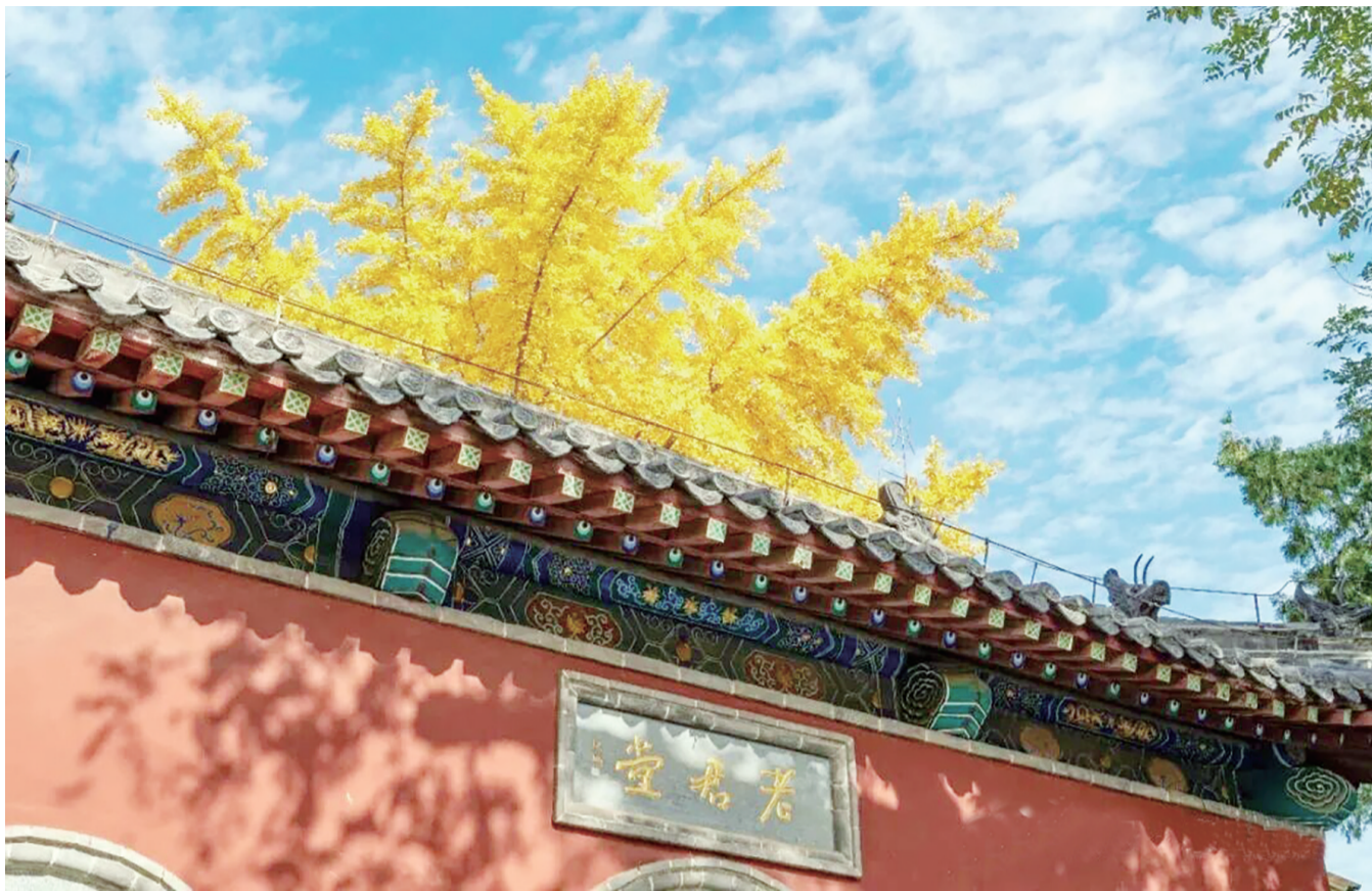
金黄的银杏叶与古建筑相映成趣。