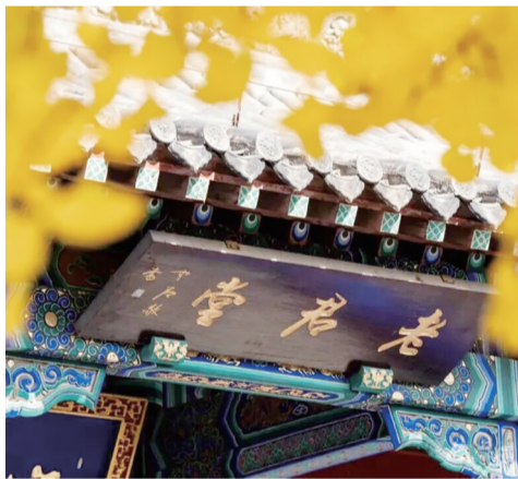
青砖黛瓦银杏相伴。