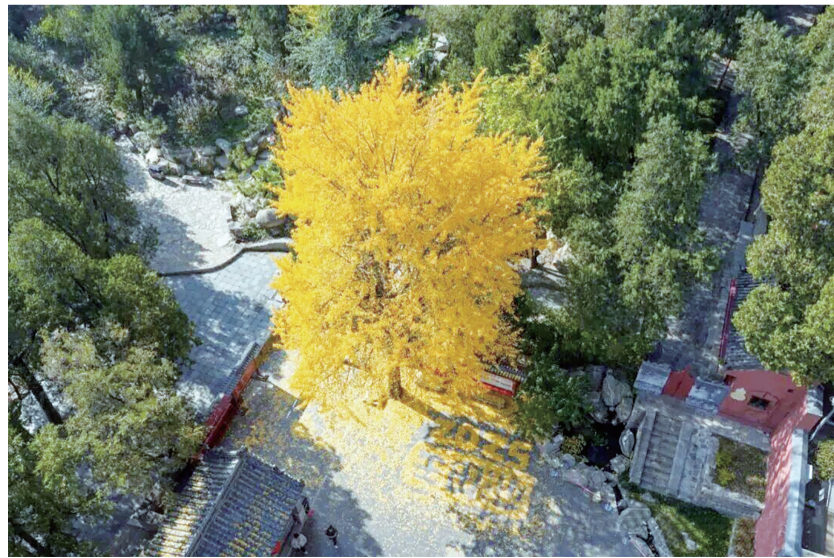
银杏参天，满树金黄。