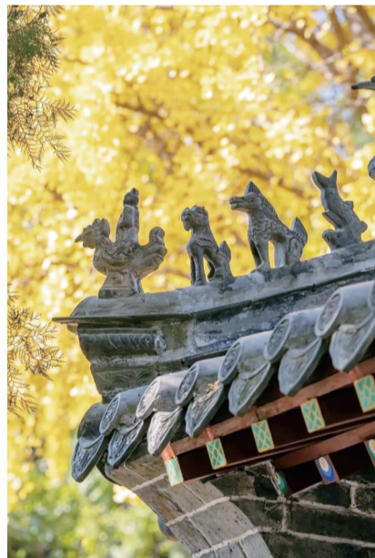
片片金叶将飞檐翘角衬托得更加灵动。