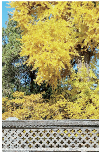
阳光将银杏叶染得愈发透亮。