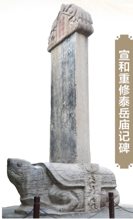
宣和重修泰岳庙记碑

此碑是泰山所存的唯一一块立于晋代的石碑。原立于新泰市新甫山下张孙庄村，现位于岱庙东碑廊。