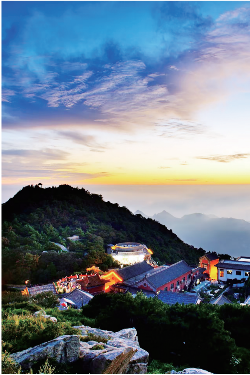
当清晨的第一缕阳光奋力穿透云海，泰山便从沉睡中苏醒。