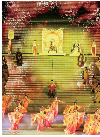
《中华泰山·封禅大典》。

泰山封禅，源于古代帝王对山岳的封禅祭祀。封禅是古已有的礼仪。按照《史记·封禅书》张守节《史记正义》解释：“此泰山上筑土为坛以祭天，报天之功，故曰封。此泰山下小山上除地，报地之功，故曰禅。”古人认为泰山是和上苍沟通的最佳地方，来泰山进行封禅是和天地最有效的交流方式。