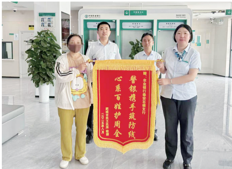
王女士（左一）将锦旗送到工作人员手中。