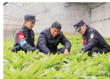
民警在大棚内了解蔬菜生长情况。

本报讯（通讯员 刘文龙）眼下，正值春耕的黄金时节，市公安局泰山分局民警深入辖区蔬菜大棚，了解蔬菜生长情况，并向辖区居民普及反诈知识。 近年来，市公安局锚定“让党放心，让群众安心”的工作目标，全力维护社会稳定。各基层派出所将“降警情、控发案”作为主要任务，持续优化派出所主防、立体防控、新时代群防群治和大众宣传工作，不断提高整体防控效能。