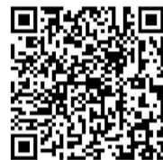
扫码查看详细名单