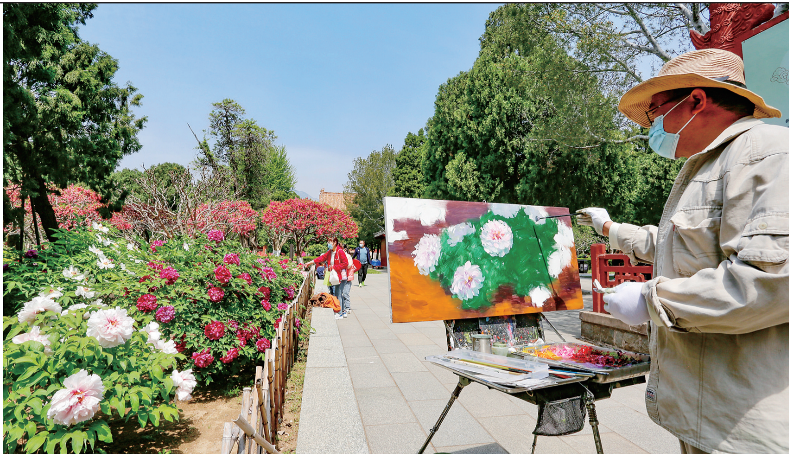
市民用画笔描绘春光。