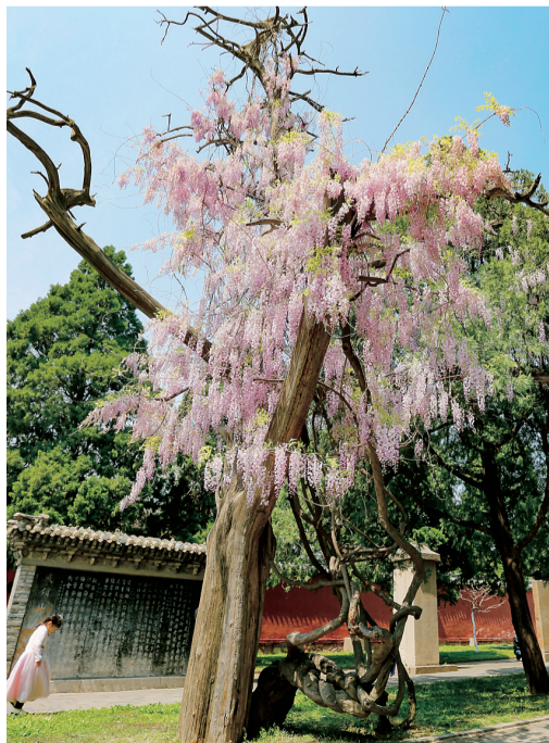
古树、鲜花相映成趣。