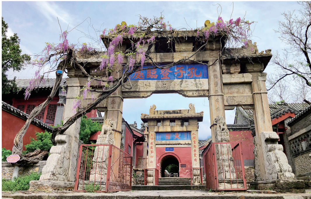
泰山孔子登临处紫藤花盛开。