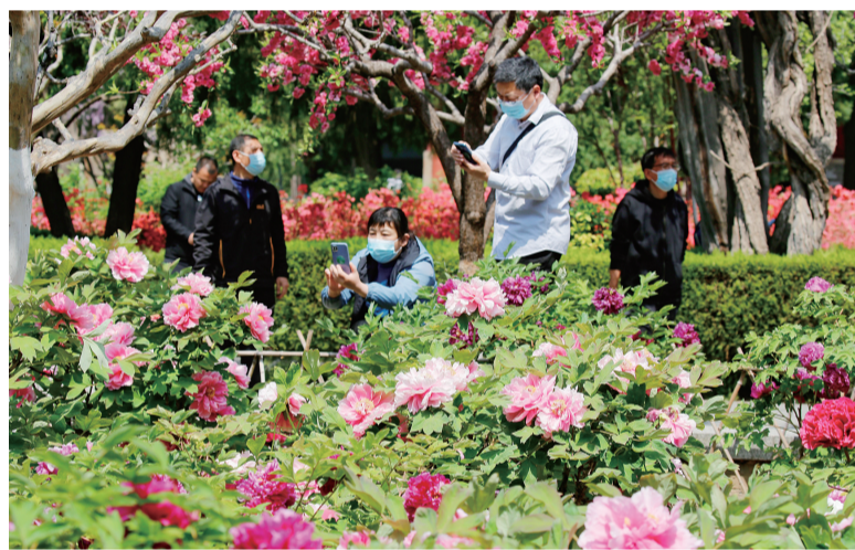
市民赏花时拍照留念。

最美人间四月天。四月的泰山上下，处处是开得烂漫绚丽的花儿，似是春姑娘打翻了调色盘，绘出五彩斑斓的画面。徜徉其中，步步“生花”，处处是风景。