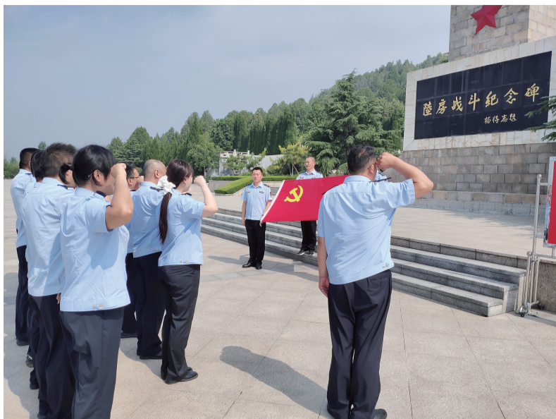
党员干部重温入党誓词。