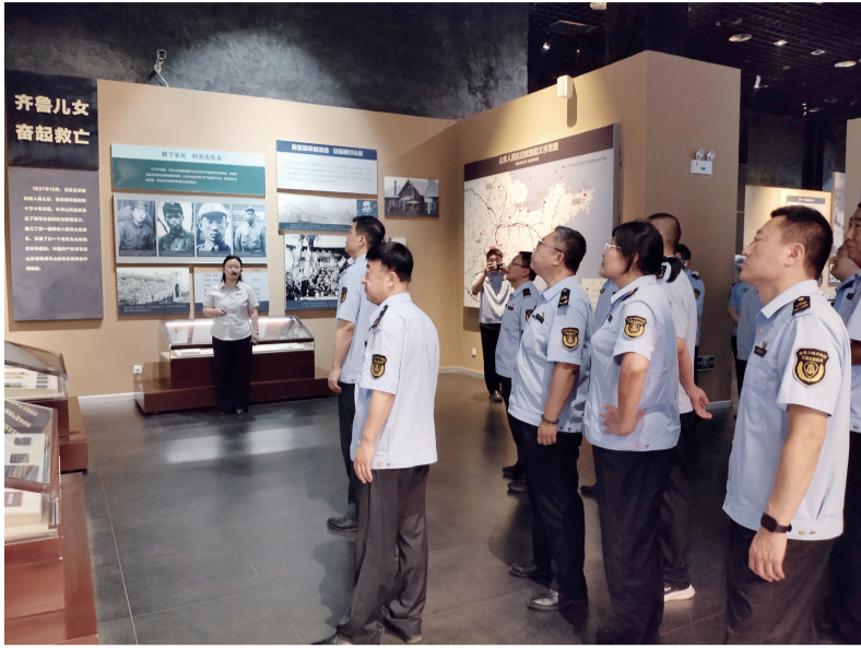
在讲解员的带领下,党员干部驻足观看展品。

地,全体党员干部怀着崇敬之心瞻仰烈士纪念碑。面对鲜红的党旗,大家重温入党誓词,铿锵有力的誓言响彻现场,既是对入党初心的坚定回望,又是对党忠诚、为民奉献、矢志不渝为党的事业奋斗终身的庄严承诺。