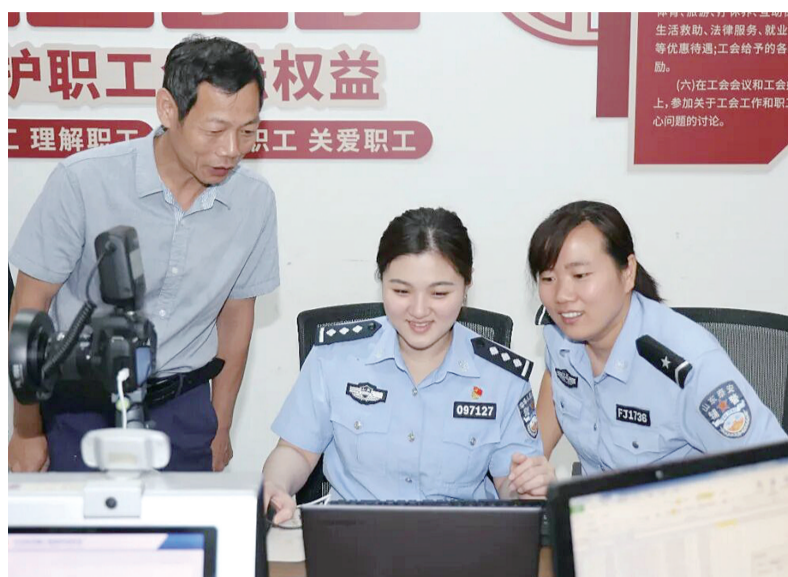
民警为企业职工办理身份证换领业务。

然而,企业实行闭环军工生产管理,流水线全天运转,在岗人员缺一不可,职工很难在工作时