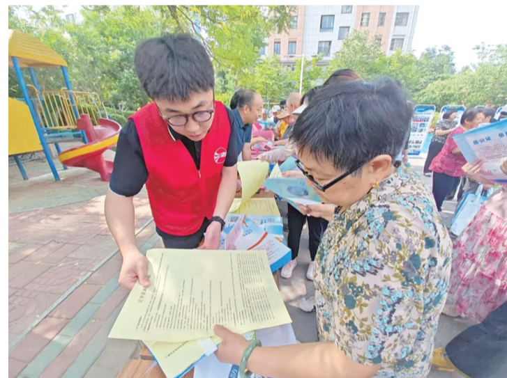
工作人员为老年人讲解法律条文。

本报7月6日讯(记者 董文一)近日,岱岳区法律援助中心走进粥店街道物探家园小区,开展“法治银龄 法律援助同行”法律援助志愿服务活动,将优质法律服务送到老年人身边,以法治温情守护最美“夕阳红”。