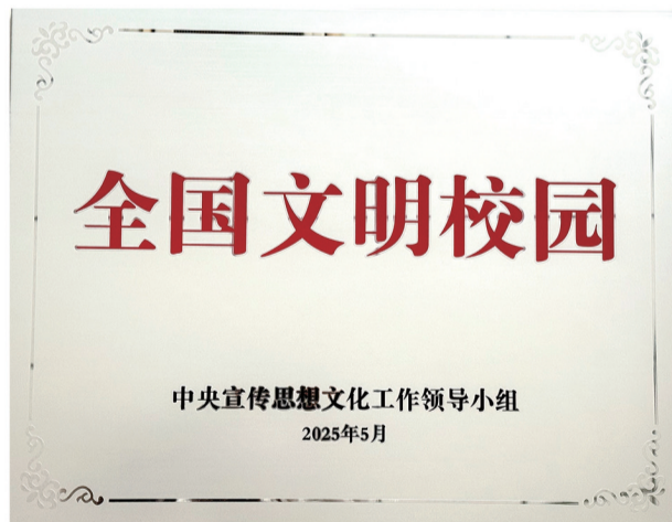
▲全国文明校园牌匾