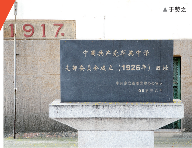
▲中共萃英中学支部成立旧址