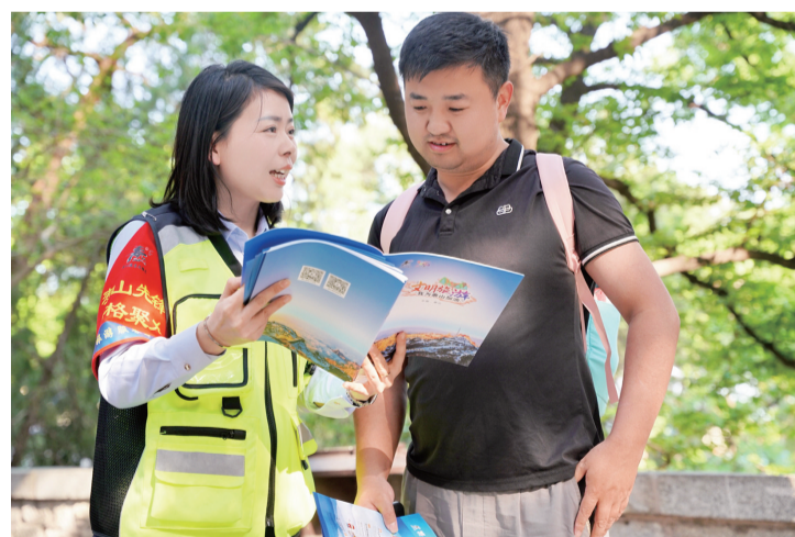
工作人员为游客讲解游览注意事项。

本报4月28日讯(记者 刘小东)“五一”假期临近，泰山景区旅游服务中心提前部署，积极开展文明旅游引导专项工作，全力营造安全、有序的旅游环境。