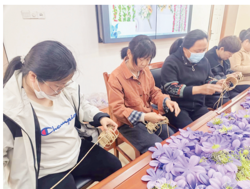
学员练习手工编织技法。

“没想到我一个零基础的人，也能做出这么精致的手工作品。老师讲得非常细致，以后在家就能接订单，既能照顾家人，又能挣零花钱。”参训学