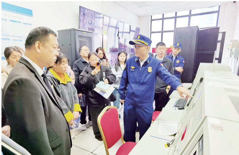
消防监督人员为相关工作人员进行培训。

泰山风景名胜消防救援大队组织基层消防工作人员及消防控制室值班人员开展实战应用专题培训。培训采取理论讲解、集中考试、实操演练相结合的形式,紧扣单位消防安全管理要点、消防设施操作规范、初起火灾处置和人员疏散引导等内容展开,通过实战化演练提升参训人员的应急处置能力。