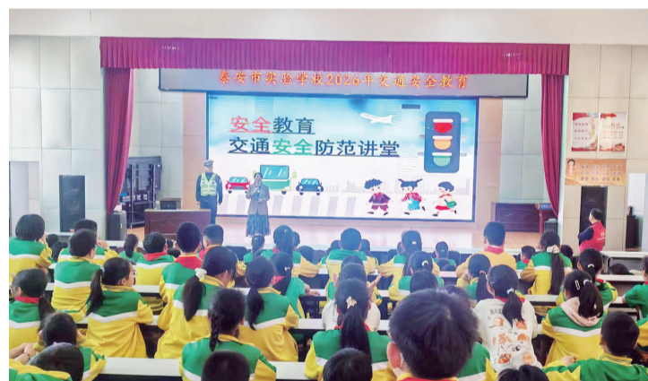
交警讲解交通安全知识。

本报4月20日讯(记者 张智凯 通讯员 侯晓彬)为进一步增强辖区群众的道路交通安全意识,提升自我防范能力,减少校园周边交通事故发生,日前,泰安交警城东大队交警到泰安市实验学校开展2026年交通安全宣传进校园活动。