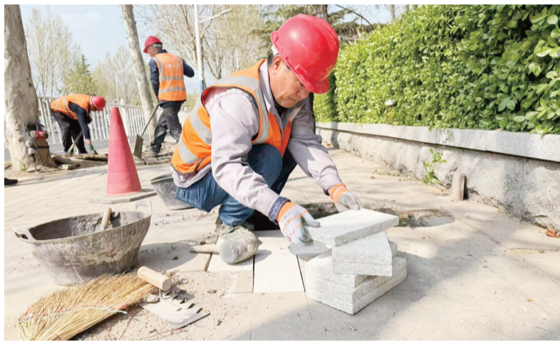
■施工人员更换道板。