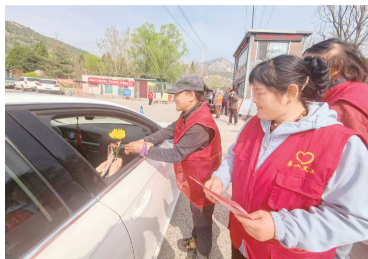
■志愿者为群众发放森林防火宣传页和黄菊花。