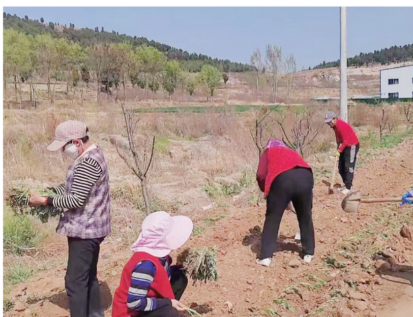
■村民整理地块栽种艾草。

“村里的边角地以前荒着没人管，杂草丛生还影响村容村貌，现在整合起来种艾草，大家一起出力干活，村里