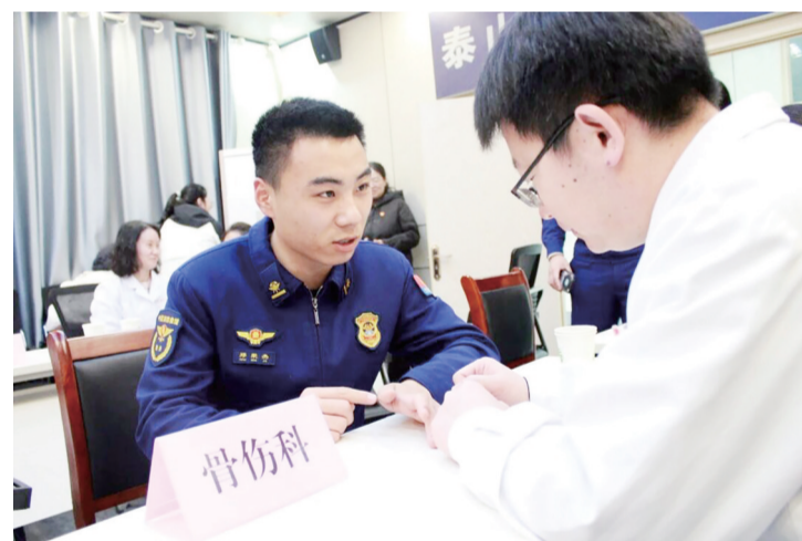
专家详细了解消防指战员的身体状况。

本报3月30日讯(记者 张智凯)近日,山东中医药大学附属医院组织医护人员走进市消防救援支队,开展主题为“岐黄赓续雷锋志,本草情暖火焰蓝”的消防指战员专场健康义诊活动。