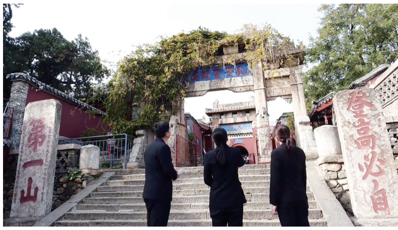
法院干警实地查看泰山文物古迹保护情况。

泰山作为世界文化与自然双遗产,不仅是齐鲁大地的生态脊梁,还是中华文明的精神地标。泰山区人民法院锚定“双遗”保护司法需求,以“巍然承枫”环资审判品牌为抓手,用专业审判筑牢生态屏障,用创新实践破解保护难题,以司法担当守护千年文脉。