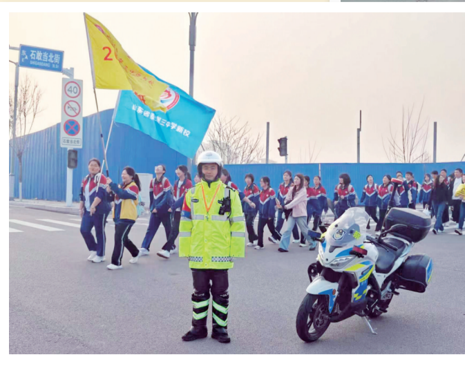
交警护航师生安全出行。

此次保障工作既是践行警校共建理念、守护校园安全的具体举措,又充分彰显了交警恪尽职守、为民护航的责任担当与职业精神,为活动顺利开展提供了坚实的交通保障,赢得了学校师生的一致好评。