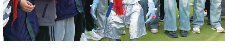
学生与人形机器人互动。