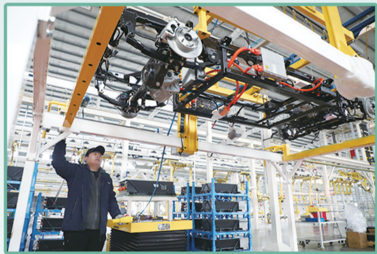
山东远程本途新能源汽车有限公司生产车间。