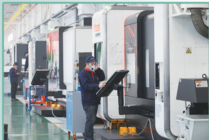
泰和电力数字化智造生产线井然有序。