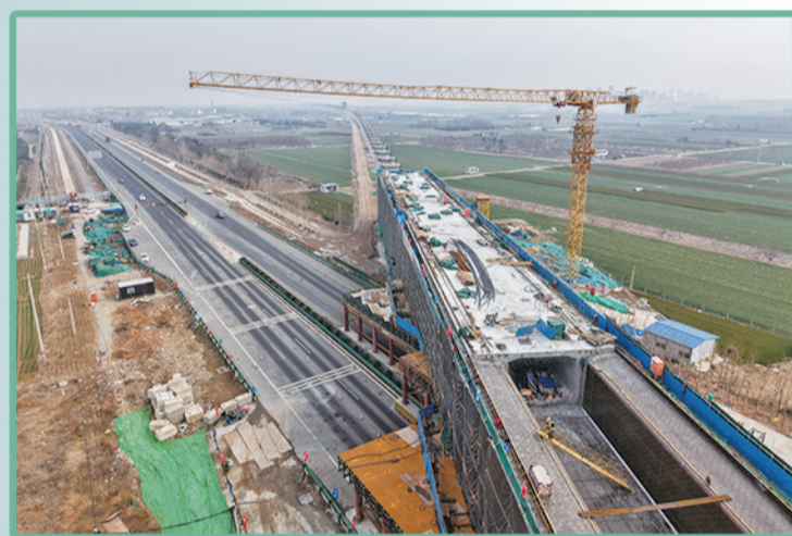
济枣高铁泰山区段建设如火如荼。