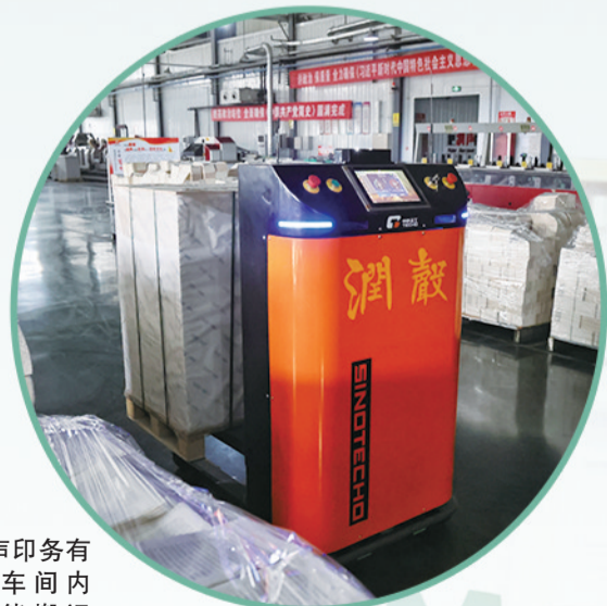
山东润声印务有限公司车间内AGV智能搬运小车来回穿梭。