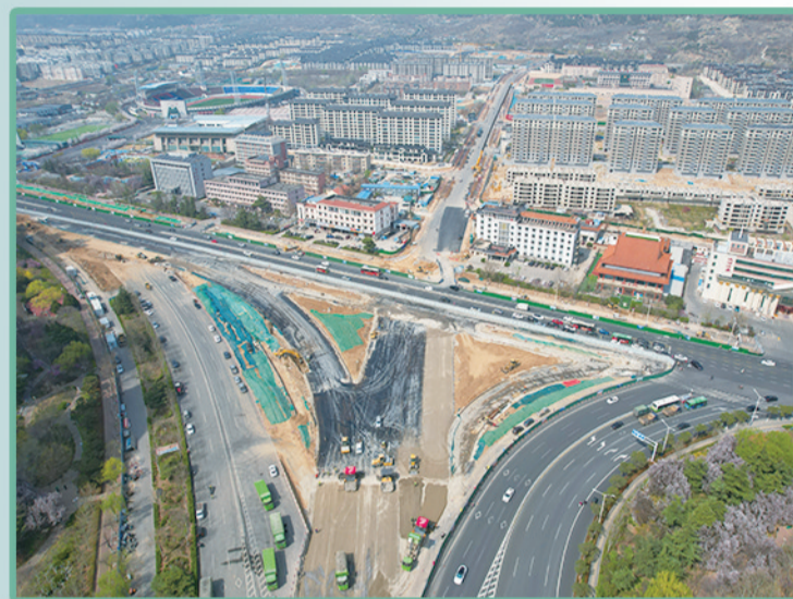
长城路与东岳大街路口改造工程进入攻坚阶段。