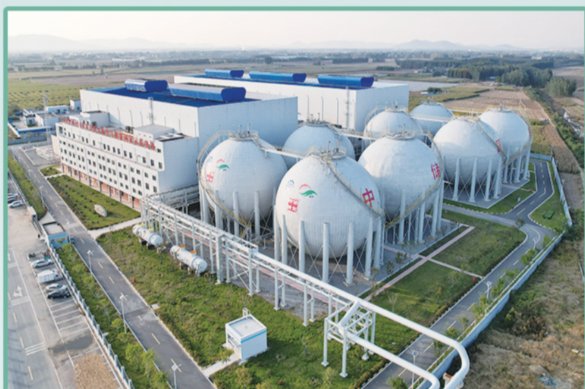
山东肥城300MW先进压缩空气储能国家示范电站项目。

春回大地，万物竞发。近日，记者走进位于新泰市果都镇的山东远程本途新能源汽车有限公司生产车间，一派繁忙景象映入眼帘。自动化生产线高速运转，工人们各司其职、配合默契，正全神贯注地组装着一台造型灵动的低速无人配送车。这些搭载前沿技术的智能车辆，即将驶向城市物流的第一线，为现代物流注入“智造”新动能。