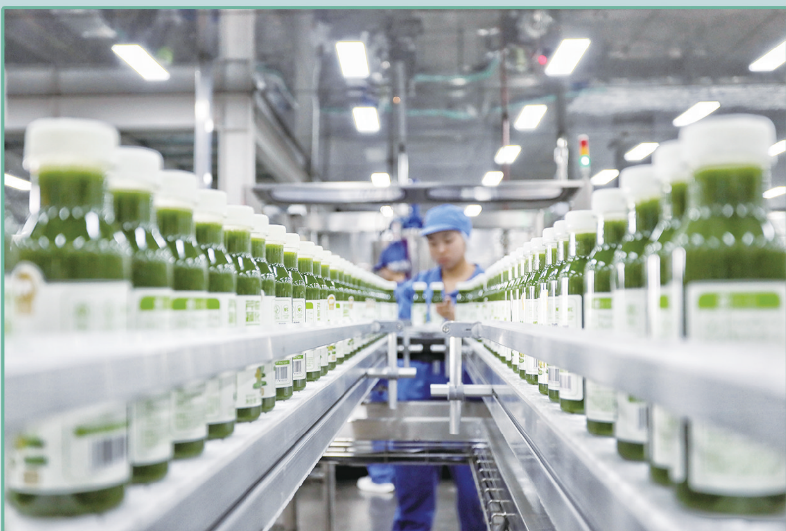
山东唯可鲜食品科技有限公司生产车间智能化生产线快速运转。