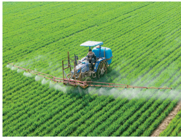
3月25日，河南省三门峡市灵宝市西阎乡西古驿村农民在麦田进行“一喷三防”作业(无人机照片)。时下正值春季农事关键期，各地农民抢抓农时，开展春耕作业，田间地头一片忙碌景象。