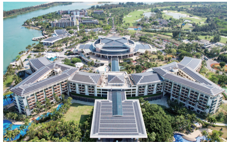
在博鳌零碳示范区拍摄的博鳌亚洲论坛国际会议中心和博鳌亚洲论坛大酒店屋顶的光伏设备(3月19日摄，无人机照片)。自2025年3月“博鳌近零碳示范区”更名为“博鳌零碳示范区”以来，示范区节能降碳成效显著，已全面进入常态化“零碳运行”阶段。据实测数据显示，2025年博鳌零碳示范区建筑和市政基础设施能源相关二氧化碳排放量已从2019年的11350.1吨降至约14.6吨，实现减碳99.9%。示范区全年生产绿电2900万度，既满足示范区每年约1940万度的用电需求，又可将剩余960万度绿电上网。