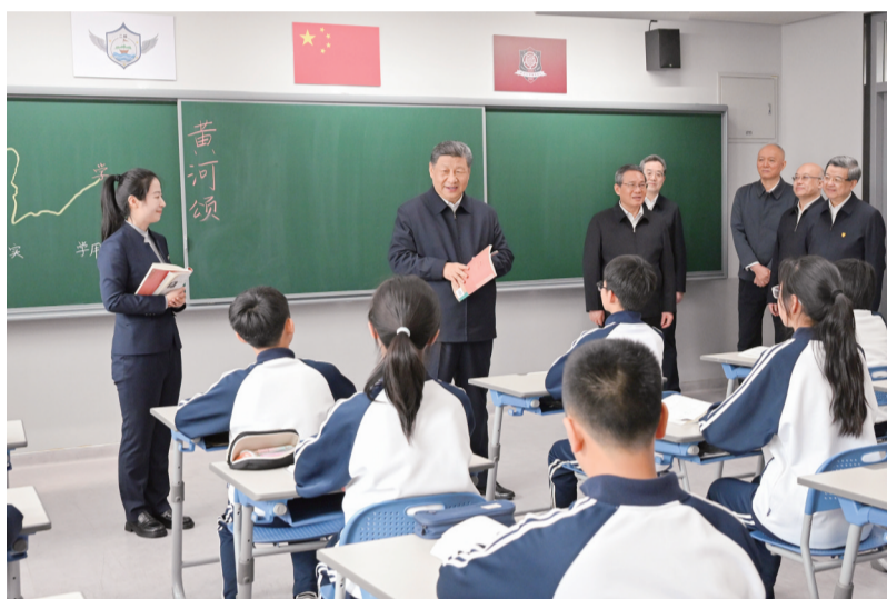
3月23日,中共中央总书记、国家主席、中央军委主席习近平在河北雄安新区考察,并主持召开深入推进雄安新区高质量建设和发展座谈会。这是23日上午,习近平在北京四中雄安校区考察时,走进教室同师生亲切交谈。