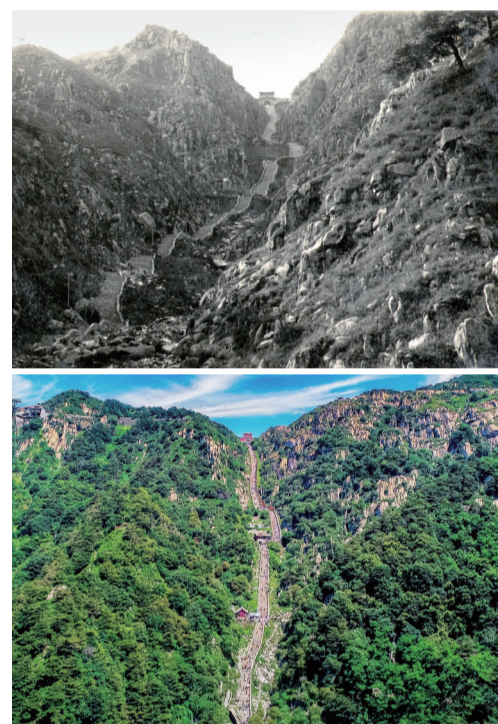
泰山南天门植被今昔对比图。

在张耀南的带领下，1960年泰山林场实现粮菜林大丰收，1965年泰山林场基本完成造林任务。据统计，他担任场长期间，泰山林场植树造林7.3万亩，补植5.2万亩，幼林抚育47.2万亩次，泰山森林覆盖率由31.7%提升至81.3%，实现了从“局部绿”到“全域绿”的转变。