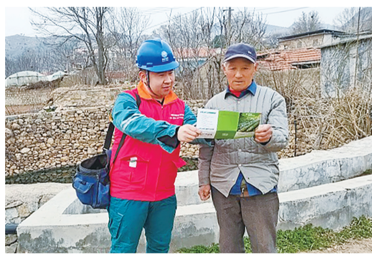
■工作人员为农户讲解安全用电知识。

本报3月18日讯(记者 温雯)春耕时节，农田灌溉进入关键阶段，农业生产用电需求显著增加。近日，国网泰安供电公司组织工作人员深入田间地头，开展灌溉用电设备隐患排查和安全用电知识宣传工作，全力为农业生产保驾护航。