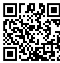
扫码查看优惠政策