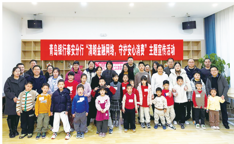
活动现场。

为增强社区居民对金融诈骗的防范意识,丰富居民金融知识储备,营造安全、和谐、稳定的社区金融环境,2日至6日,青岛银行泰安分行组建“青银志愿服务队”,先后走进肥城市康诚丽都社区及新泰市田园社区、教师苑