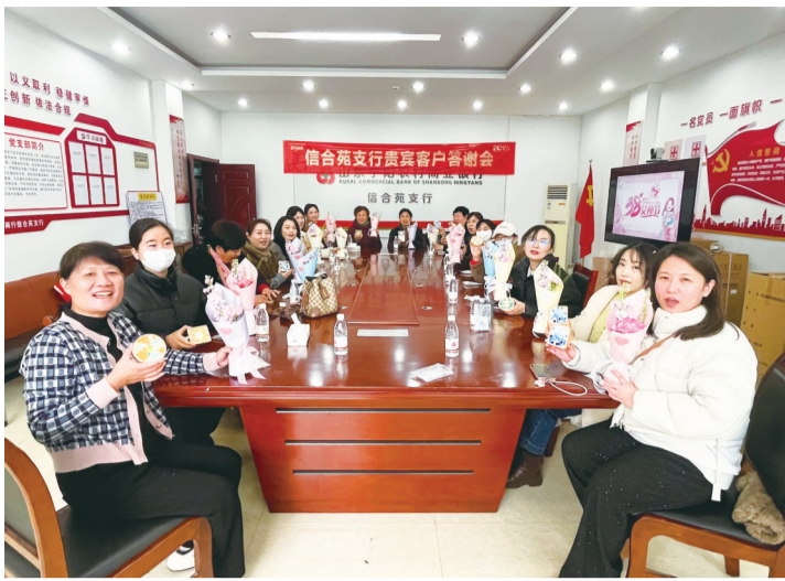
客户展示制作的杯垫。