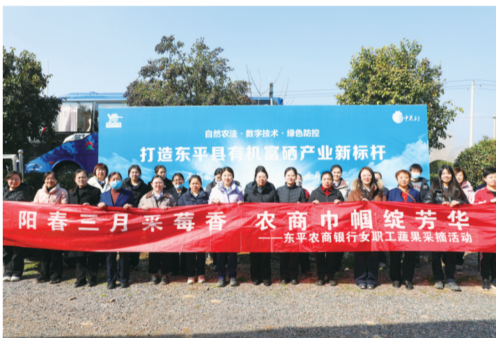
银行开展蔬果采摘活动。

本报3月11日讯(通讯员 张蕾蕾 张晓君)阳春三月,暖意融融。为庆祝“三八”国际妇女节,进一步丰富女职工工业余文化生活,舒缓工作压力,增强团队凝聚力,近日,东平农商银行组织在岗女职工开展蔬果采摘活动,让大家在亲近自然、收获甜蜜中欢度节日,展现新时代农商女职工昂扬向上的精神风貌。