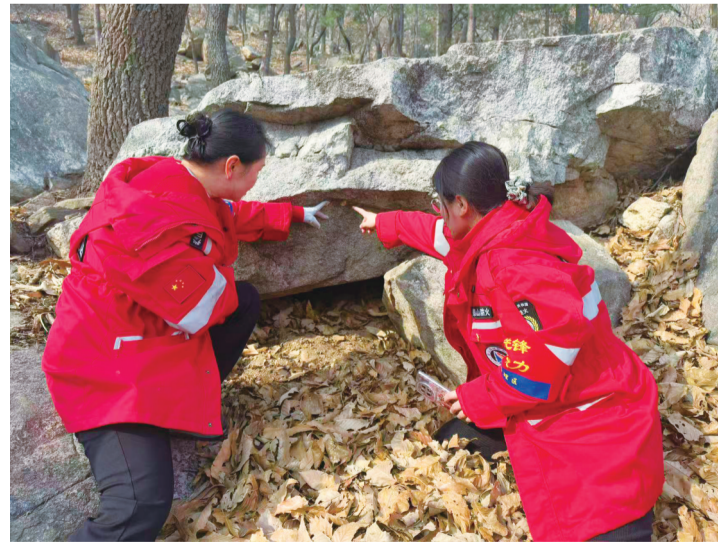
■林业技术人员调查虫卵分布情况。

本报3月11日讯(记者 刘小东 通讯员 丁鸿尧)近日,泰山景区天烛峰管理区组织林业技术人员开展越冬后虫情调查工作,以全面掌握林业有害生物越冬情况,预判舞毒蛾、松扁叶蜂等害虫发展趋势,确保森林资源安全和生态环境稳定。