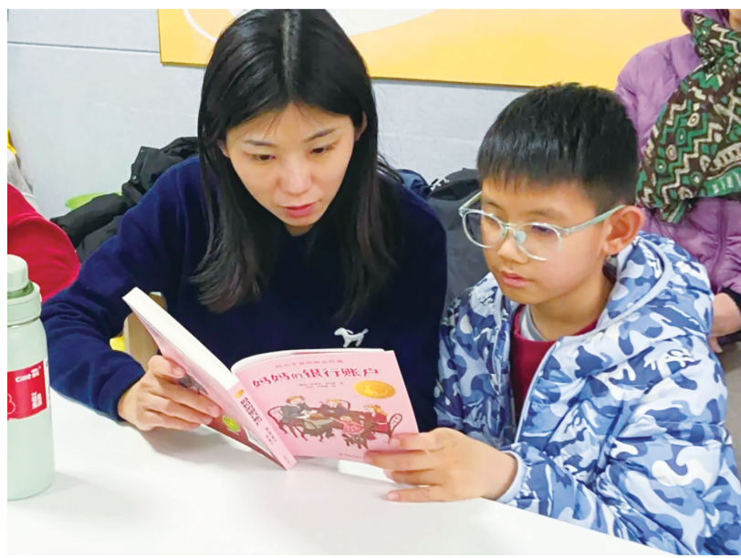
■亲子共读《妈妈的银行账户》。

“本书以朴素笔触勾勒出母爱的深沉智慧,书中母亲并非以说教传递道理,而是用默默的付出与善意的守护,给予孩子面对生活的底气。这种