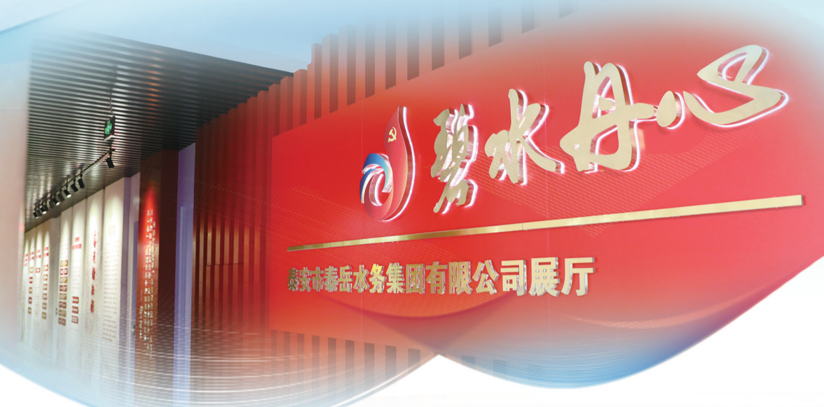
泰安市泰岳水务集团有限公司展厅

时代浪潮奔涌不息，城市发展水务先行。作为城市保障的先行官，2025年，泰安市泰岳水务集团有限公司锚定“综合性水务运营服务商”功能定位，坚持把党的领导贯穿企业发展全过程，以重大项目筑牢发展根基，以精细服务回应群众期盼，以创新管理激活内生动力，在保障供水安全、优化水资源配置、拓展产业布局的征程上勇毅前行，以实干担当书写新时代水润万家的民生答卷。