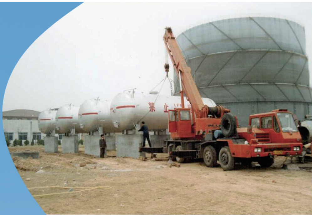
【1998年3月】增建液化气混掺设备。