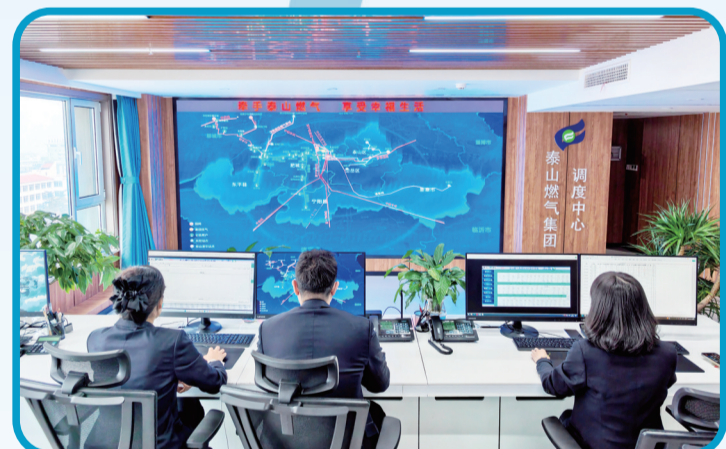
【2025年】“智慧燃气”一期落地。

这一阶段，泰山燃气集团从“扩网”到“强链”的跃进，印证了国企通过产权改革、战略升级、开放合作能够激活内生动力、释放发展活力，为中国特色现代企业制度建设和完善提供了地方样本。