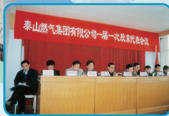
【2003年】泰山燃气集团召开第一次股东大会。