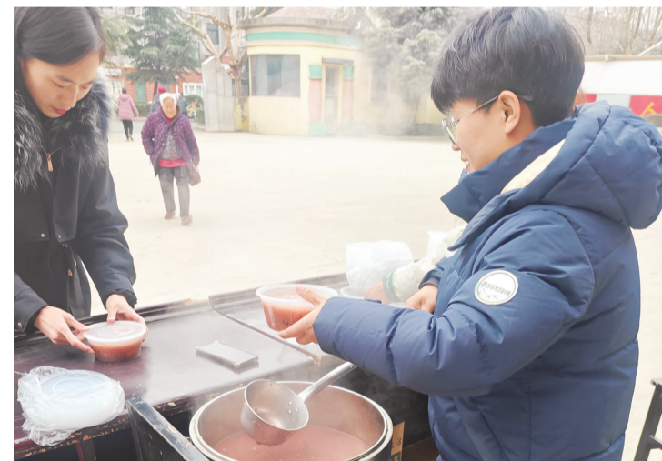
■志愿者打包腊八粥。