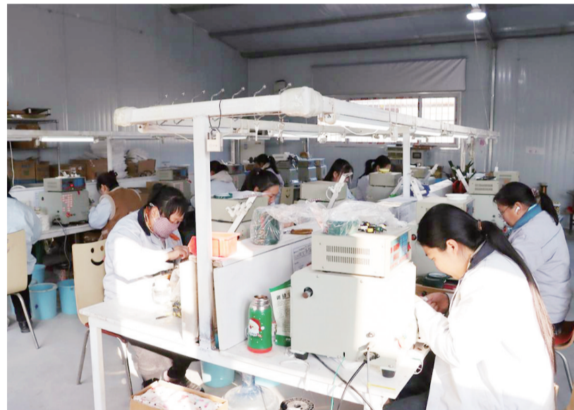
■工人在车间里忙碌。