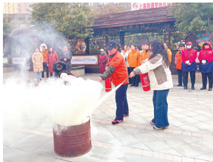
■居民进行灭火演练。

本报1月20日讯(记者 刘小东 通讯员 孙磊)近日,泰山山区上高街道苑苑社区联合城金物业、绿漫云物业,特邀山东泰安应急消防职业培训学校专业教官,共同开展消防安全演练活动。社区网格员、志愿者、物业公司员工及居民积极参与活动,以实战演练筑牢社区平安防线。 演练中,专业消防安全员向居民细致讲解了家庭火灾预防关键点、不同场景下的逃生自救技巧,以及灭火器、消防栓等常见消防器材的使用原理。 随着尖锐急促的火警报声响起,消防演练进入实战环节。社区工作人员迅速启动应急疏散预案,引导居民用湿毛巾捂住口鼻,弯腰低姿,按照预定疏散路线,沿安全通道快速、有序地向指定集合点撤离。集结完毕后,消防安全员现场演示了灭火器的规范操作流程,并详细讲解了操作过程中的安全事项。部分居民主动参与实操练习,在消防安全员的指导下掌握了灭火器的正确使用方法和理论知识转化为实战能力。 “此次消防安全演练活动通过‘理论讲解+实战演练+实操练习’模式,有效增强了居民的消防安全意识,提升了居民的应急反应和自救互救能力。”苑苑社区相关负责人表示,将持续常态化开展消防安全宣传与演练活动,不断创新形式、丰富内容,持续强化居民安全防护意识,为辖区居民打造安全、和谐、稳定的居住环境。