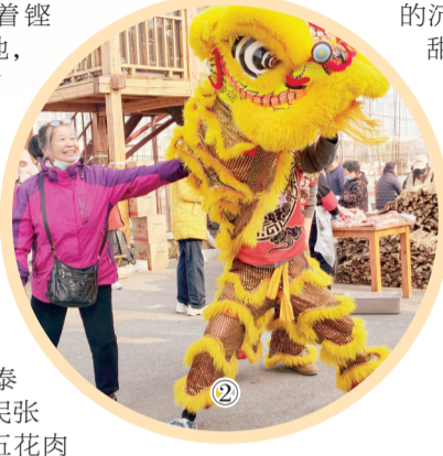
①市民共享杀猪宴。 ②舞狮表演。 ③志愿者为市民盛菜。