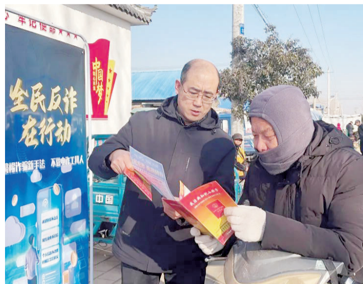
■志愿者为群众讲解反诈知识。

本报1月20日讯(记者 董文一)近日,宁阳县司法局乡饮司法所联合乡综治办、派出所等部门,借助乡饮大集人流密集、覆盖面广的有利条件,开展“民法典+反诈”主题普法宣传活动,将实用的法律知识与易懂的反诈技巧送到群众身边,使普法宣传更接地气、更入民心。 “大叔,陌生电话说您中奖可千万别信,转账前一定得跟家里人商量。”“大姐,我帮您装个国家反诈中心App,开启来电预警,能自动拦截诈骗电话。”活动现场,志愿者们针对乡村中老年群众居多、防范意识相对薄弱的特点,用亲切的乡音拉近关系,围绕养老诈骗、刷单返利、冒充客服、虚假投资等高发骗局,结合真实案例生动讲解诈骗手法与识别技巧。宣传过程中,志愿者还积极发动集市摊主担任“流动宣传员”,鼓励他们在日常经营中提醒顾客增强防范意识,推动形成“一人带一户、一户带一片”的反诈传播效应。 此次活动累计发放宣传资料600余份,回复群众咨询150余人次,协助30余名群众安装国家反诈中心App,有效提升了群众对电信网络诈骗的识别和防范能力。宁阳县司法局将持续推进反诈宣传工作常态化、精准化,进一步整合资源、拓展形式,推动宣传从“广覆盖”向“深渗透”转变,全力营造全民反诈、全社会反诈的浓厚氛围。