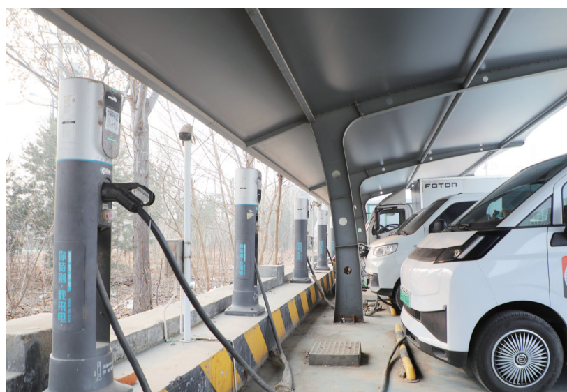
■充电站里,停满了正在充电的车辆。

智能化更高,驾驶体验更好……目前,新能源汽车市场占有率不断提高。“充电是否方便,充电是否安全,直接影响市民购车选择。”泰安市国信特来电新能源有限公司董事长李元征介绍,该公司在全市运营着900多台充电设备,按照居住区、办公区、商业区、工业中心、休闲中心的“两区三中心”布局,城区率先实现既定目标,并逐步向县(市、区)、乡镇延伸。针对城乡差异,我市推出差异化