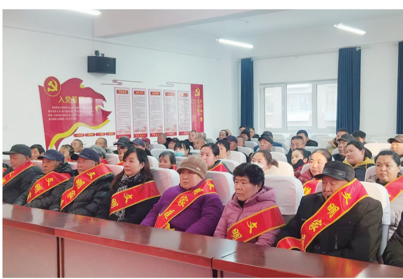
表彰大会现场。

表彰大会对通过道德评议会民主评议、公开公示等环节,最终评选出50个“文明家庭”、26位“好婆婆”和26位“好媳妇”,并为她们颁发奖品,对他们践行孝道、和睦邻里、勤俭持家的优良品行给予高度肯定。一名“好媳妇”在分享感言时说:“照顾老人是子女的本分,家中有老是个宝,能陪伴他们、让他们安享晚年,我