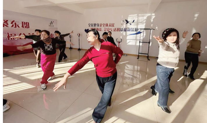
居民在“郡享书院”排练舞蹈。

本报1月7日讯(记者 张芮)“以前这里比较冷清,现在建成书院后,成了大家的聚集地。”提起“郡享书院”,家住泰山区岱庙街道东郡社区的一位居民赞不绝口。如今,这里已成为社区的重要公共文化空间。