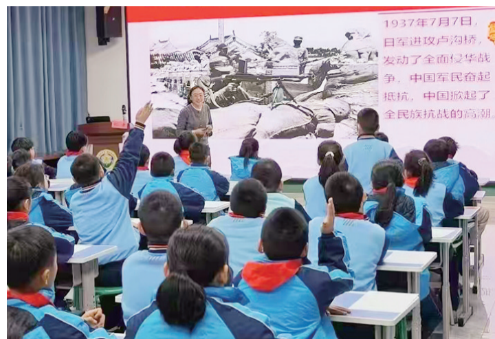
■工作人员为学生讲述抗战历史。