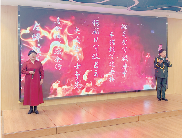
■诗文朗诵联谊会现场。通讯员供图