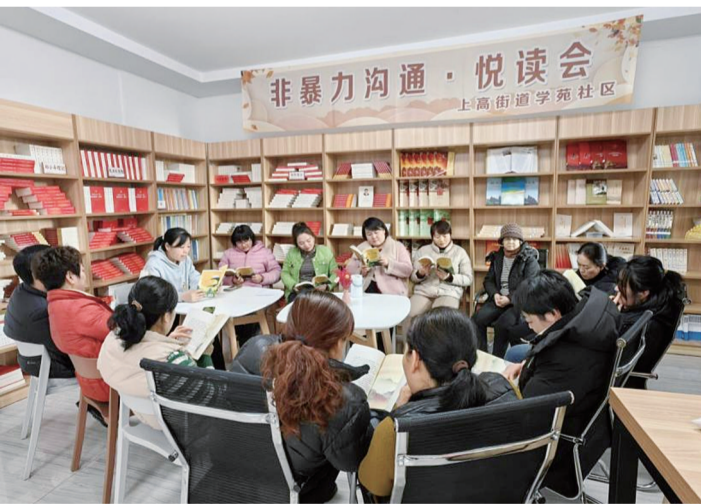
■上高街道学苑社区举办阅读活动。

本报12月29日讯(记者 刘小东 通讯员 黄丽娜)今年以来,泰山区在全民阅读工作中持续深耕细作,在全域统筹强根基、多方协作聚合力的基础上,立足各乡镇(街道)独特的文化底蕴与居民多样化需求,创新性打造“一街一特”阅读品牌矩阵,让全民阅读从“普及化”向“特色化”“品质化”升级,为泰山区注入别样文化活力。