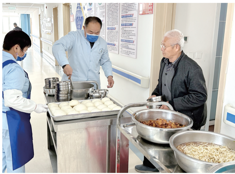
■养老服务中心工作人员为老人盛饭。

生活得更有质量、更有尊严?东平县开始了大刀阔斧的改革,成立全县特困人员供养工作专班,将14处农村敬老院整合为6处区域性养老服务中心