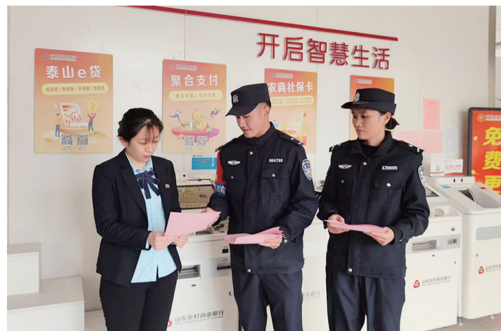
■民警为银行工作人员讲解反诈知识。

本报11月26日讯(通讯员 张涵 宿惠惠)为切实守护好群众的“钱袋子”,宁阳农商银行主动联合当地公安机关,持续深化警银合作机制,以实际行动织密反诈防护网,为维护辖区金融安全和社会稳定贡献力量。 警银联动,织密反诈“协同网”。宁阳农商银行伏山支行积极与伏山派出所对接,建立健全常态化沟通协作机制。民警定期走进银行,为员工开展反诈专题培训,详细讲解各类诈骗的识别要点、劝阻流程与处置方法,有效增强员工的反诈意识和专业能力。该行充分发挥网点前沿优势,及时向公安机关反馈可疑交易和人员线索,助力精准打击网络诈骗犯罪。警银双方信息互通、优势互补,形成“快速响应、协同处置”的反诈合力。 精准宣传,筑牢思想“防火墙”。该行以“增强防骗意识、普及反诈知识”为目标,联合公安机关开展形式多样、覆盖广泛的反诈宣传活动。在营业厅内,该行通过循环播放反诈短视频、摆放