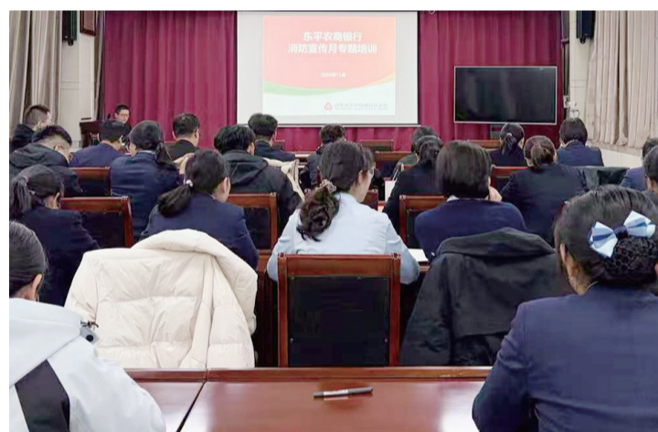
■银行举办专题培训。

本报11月26日讯(通讯员 季承元)为进一步增强职工消防安全意识,提升应对突发火灾的自救互救能力,营造“预防为主、生命至上”的消防安全环境,近日,东平农商银行在总行举办了“消防安全月”专题培训。 培训过程中,讲师结合近年来典型的火灾案例,仔细分析了火灾发生的原因、危害性及带来的深刻教训,并重点围绕消防安全“四个能力”建设,详细讲解了