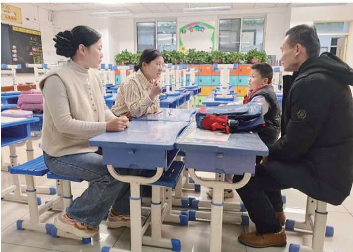
教师与家长、学生面对面交流。

本报11月26日讯(记者 肖丰芳 通讯员 程菁)为深化家校共育,全面掌握学生居家状态,搭建起坚实的家校沟通桥梁,近日,泰山区博文小学开展了家访活动。