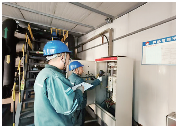
■工作人员检查电力设备运行情况。

本报11月26日讯(记者 温雯)近日,国网泰安供电公司组织工作人员走访重要供热站,开展安全用电检查,通过对供热站电力设备进行测温、测负荷,保障供暖期间设备安全稳定运行。