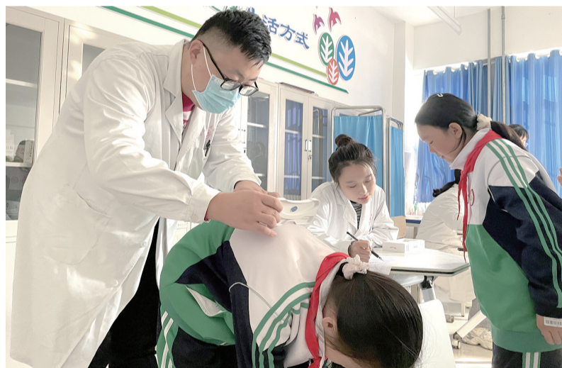
医护人员为学生进行脊柱健康检查。

本报11月17日讯(通讯员 张男)连日来，市体育局、市教育局、市卫生健康委统一部署，由市中医医院对全市中小学开展脊柱健康校园公益筛查活动，旨在推动落实我市儿童青少年脊柱侧弯防控工作，做到早发现、早诊断、早治疗，进一步改善儿童青少年脊柱健康状况，为儿童青少年的身心健康保驾护航。