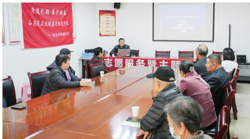
专家讲解中医“治未病”理念。

本报11月17日讯(通讯员 黄丽 吴文健)为深入贯彻落实“党建引领医疗强基”工作要求，扎实推进“万名医护进乡村”对口帮扶工作走深、走实，近日，市肿瘤医院组织中医专家团队走进对口帮扶单位泰山区财源街道社区卫生服务中心举办中医养生科普讲座。