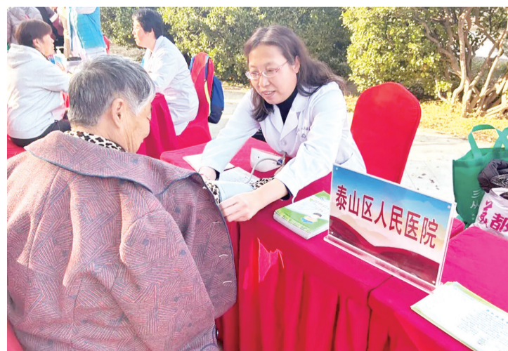
医护人员为居民测量血压。

本报11月17日讯(通讯员 李亚楠)近日，泰山区人民医院组织医护人员到泰山区岱庙街道迎春社区开展义诊活动，切实做好糖尿病防治工作，维护居民群众身心健康。