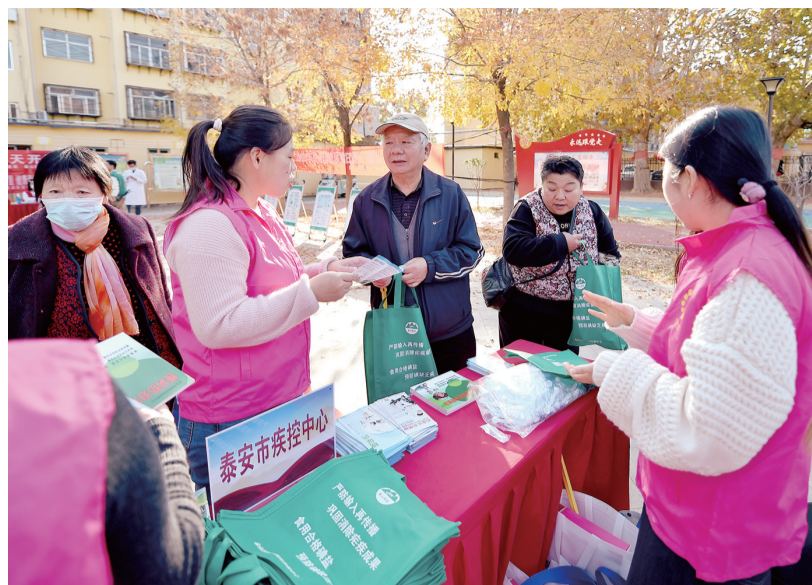
工作人员为居民提供专业咨询服务。

本报11月17日讯(记者 刘英迪 通讯员 魏峰 周媛)2025年11月14日是第19个“联合国糖尿病日”，今年的宣传主题是“糖尿病与幸福感”。为进一步提升社会公众对糖尿病的科学认知，倡导健康工作与生活方式，有效预防控制糖尿病及其并发症，近日，市疾控中心联合泰山区卫生健康局、泰山区疾控中心在泰山区岱庙街道迎春社区举办糖尿病防治主题宣传服务活动。