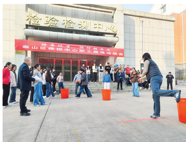
运动会现场。

本报11月17日讯(记者 于冰冰 通讯员 张琳)2025年11月14日是第19个“联合国糖尿病日”。为响应“提高认知，重在行动，关注职场糖尿病”的倡导，日前，泰山区疾控中心举行主题运动会。全体职工踊跃参与，在竞技中践行健康生活方式，凝聚团队奋进力量。