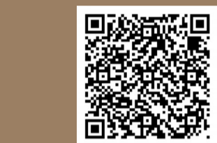
扫码查看线索征集联系方式

将具有特殊政治意义、历史意义、充分体现泰安当代重要建设成就、反映民族文化融合发展且形成广泛社会共识的区域,纳入补充调查范围。