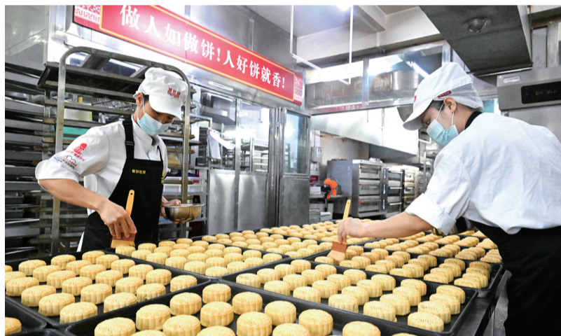
9月22日,在广西柳州市一家百年糕点企业的生产车间里,工人制作月饼。 目前,各地加紧制作月饼,供应中秋节日市场。