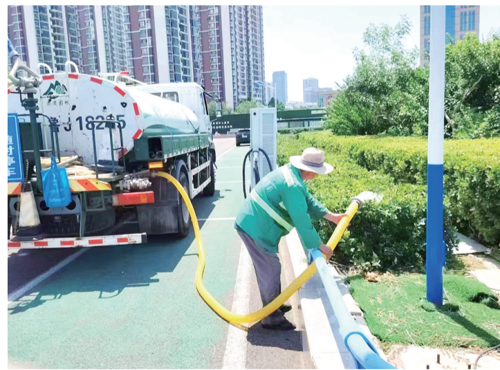
园林工人为绿植浇水。

本报6月17日讯(记者 董文一)近日,面对持续干燥少雨的严峻“烤”验,城市管理局园林绿化管理服务中心迅速行动,扎实推进抗旱保绿工作,力保绿化苗木安全度夏。 园林绿化管理服务中心绿化三所按照“科学施策、精准浇水、高效保绿”的原则,打出抗旱组合拳。综合调度水车、喷灌设施和人工力量,因地制宜满足不同区域苗木需求,特别对新栽及耐旱性差树种实施“一对一”优先浇灌;避开午间高温,在清晨和傍晚加大浇水量,有效减少蒸发,提高效率;安排专人监测土壤墒情,一旦发现旱情立即增派力量重点浇灌,确保精准响应。 园林绿化管理服务中心相关负责人表示,将密切关注天气动态,进一步加大精细化管理力度,做到抗旱工作不松劲、浇水覆盖无死角,全力守护城市绿色生命线,让城市始终绿意盎然。