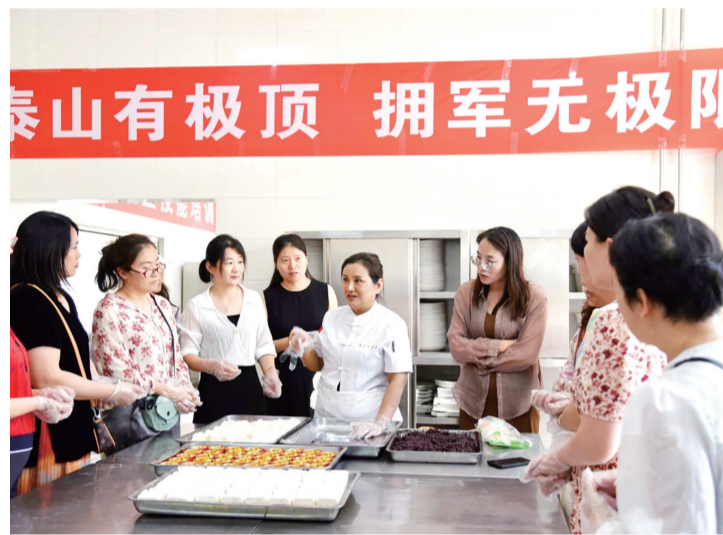
面点师为军属讲解面点烹饪要领。

本报6月17日讯(记者 李皓若)近日,市退役军人事务局组织开展随军家属职业技能培训活动,助力随军家属提升职业技能,为官兵营造和谐、温馨、温暖的大后方。 此次培训活动在提升军属就业能力、丰富其精神文化生活的同时,进一步巩固了军政军民团结良好局面。市退役军人事务局相关负责人表示,将不断完善拥军优属机制,增强军人军属荣誉感、获得感、幸福感。