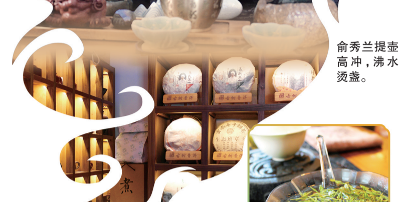
茶柜上摆放的各色茶叶。