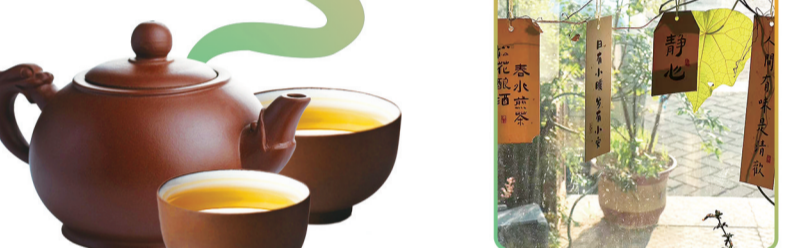
店内挂饰充满诗意。

亲、舅舅、姨母皆事茶业,母亲于20世纪90年代建立的茶叶版图,在她手中化作传承。“儿时嫌浓茶苦涩,如今却懂淡茶回甘。”她为三四岁孩童兑水泡淡茶去火,亦为古稀老者奉上陈年普洱解腻,“茶本无界,人心自有度量。”