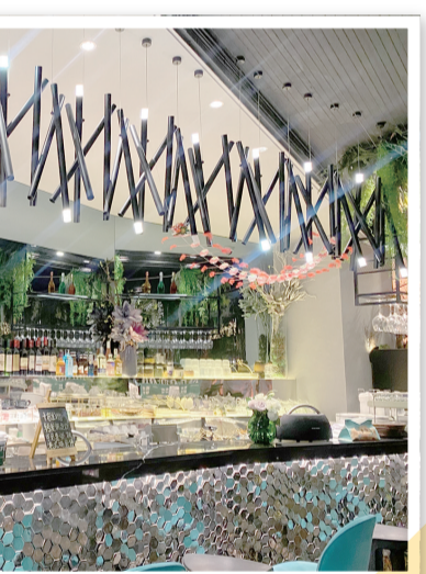
叶子花语吧台酒水区。

西餐的加入让门店开始吸引本地消费者。“很多人到店品尝披萨后觉得口味不错，带动了我们的外卖订单。”