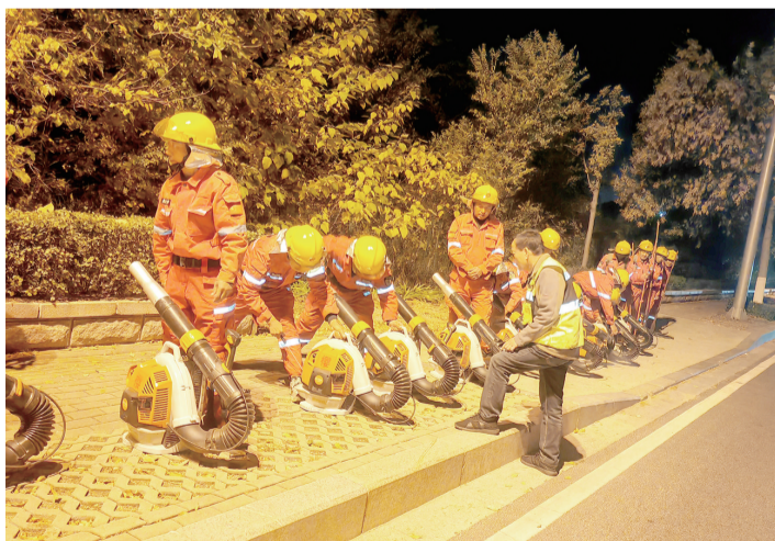
队员检查灭火设备。