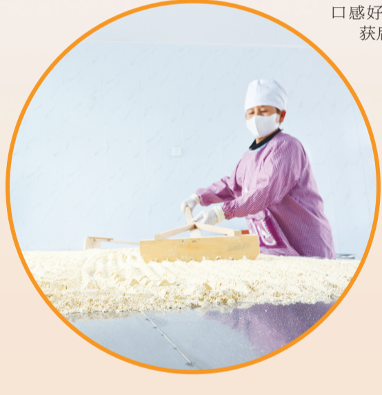
工人将炒好的茶汤摊铺晾干。

目前,北颜张村茶汤产业的发展走上了快车道,华正军又琢磨在留用的土地上做更多文章。“今年,我们打算在扩大谷子种植面积的基础上增加高粱、芝麻等高附加值特色农产品种植,补齐地方特色产业短板。五谷杂粮产品投入市场后,合作社预计年增收30万元。”对于北颜张村的特色农业发展,华正军说出了他的新想法。