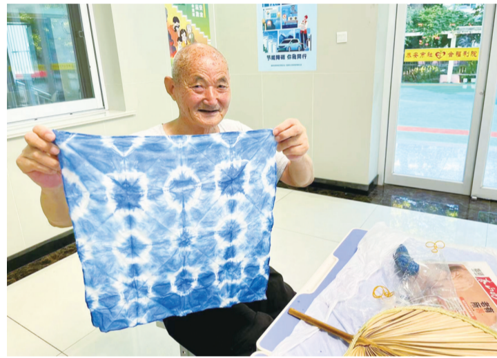
老人展示扎染作品。

本报7月23日讯(记者 杨文洁)22日,市社会福利院把大暑节气与非遗技艺相融合,举办“大暑而至、邂逅扎染”主题活动。