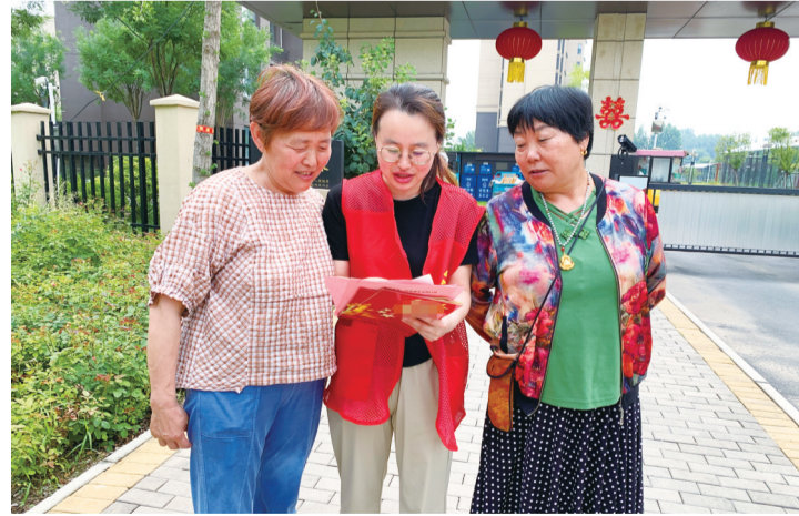
志愿者为村民发放《文明餐饮倡议书》。