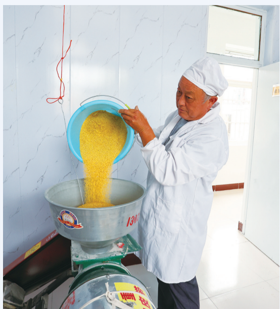
工人将洗干净的小米倒入机器研磨。