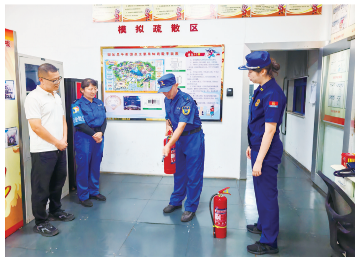
消防监督人员检查灭火器。

本报7月23日讯(记者 刘小东)近日,泰山景区消防救援大队开展辖区重点单位微型消防站消防产品专项检查活动。